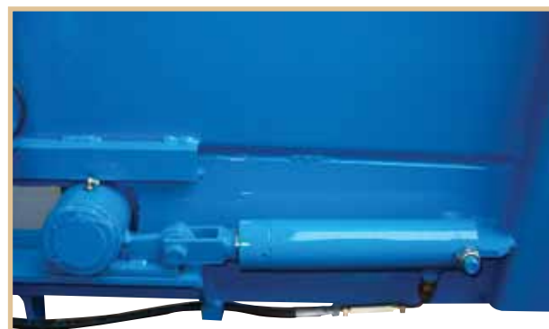
Tendicatena idraulico automatico