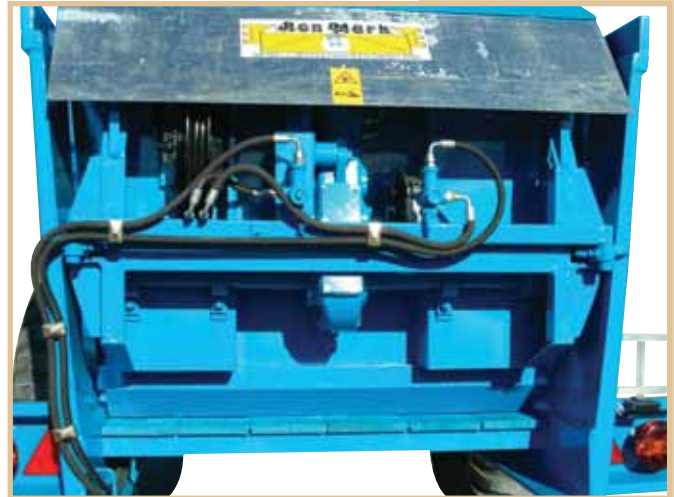
Sponda mobile idraulica senza catene