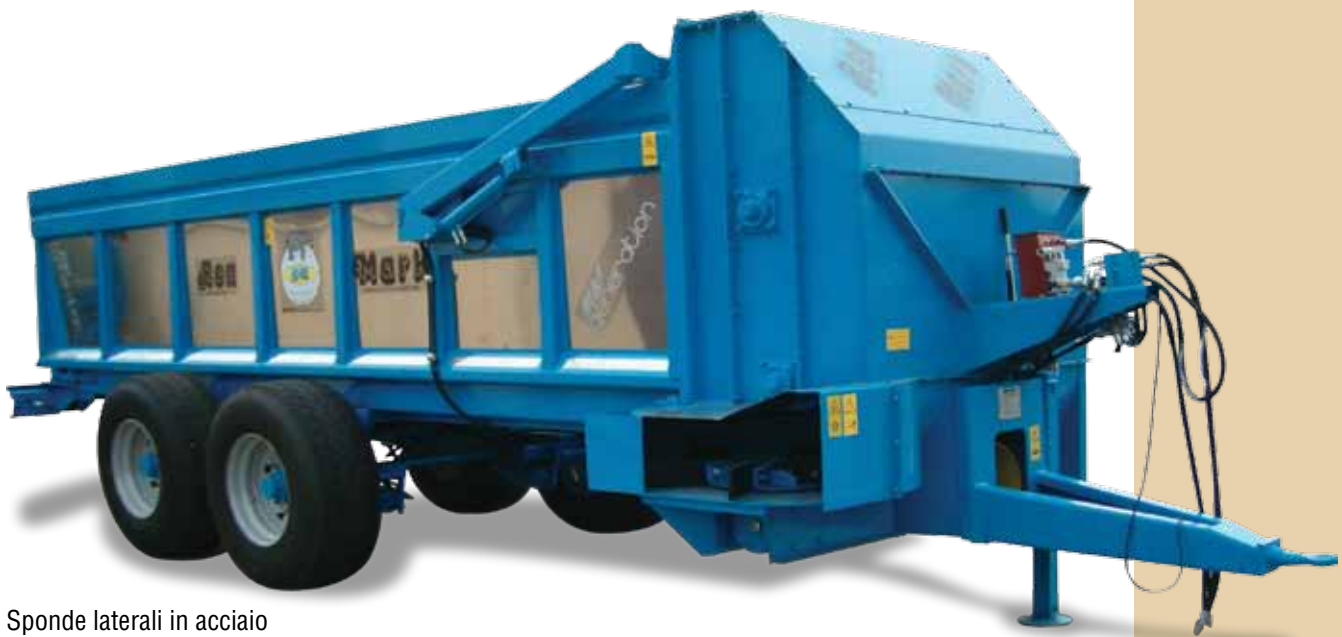
Sponde laterali in acciaio