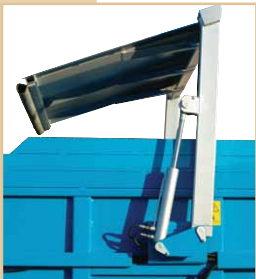
Paratoia interna idraulica