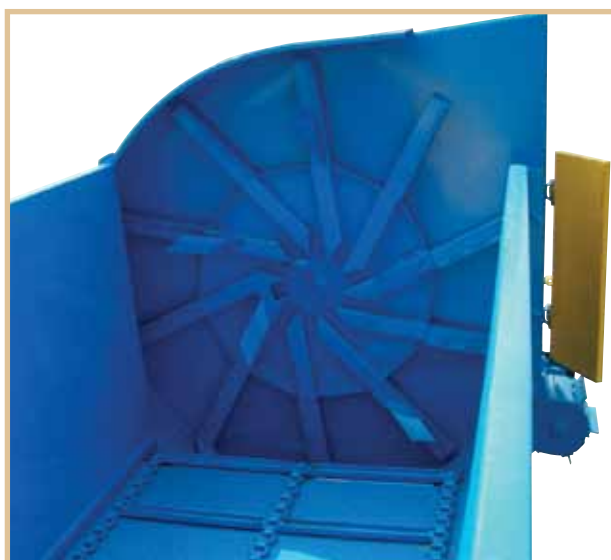
Ventola rinforzata con pale in tubolare