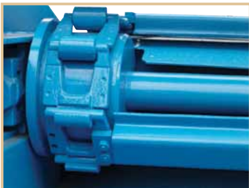
Catene speciali con traversino imbullonato