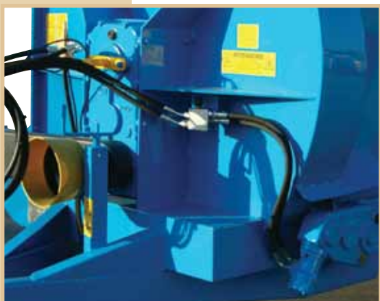
Scatola bagno d'olio e traino idraulico