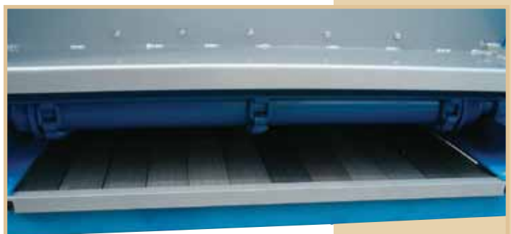
Doppio fondo in assi in plastica estraibile