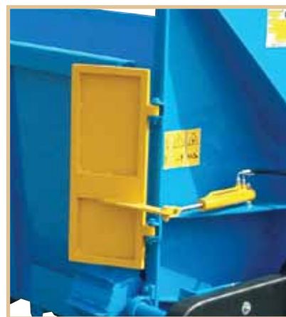
Sportellino laterale idraulico