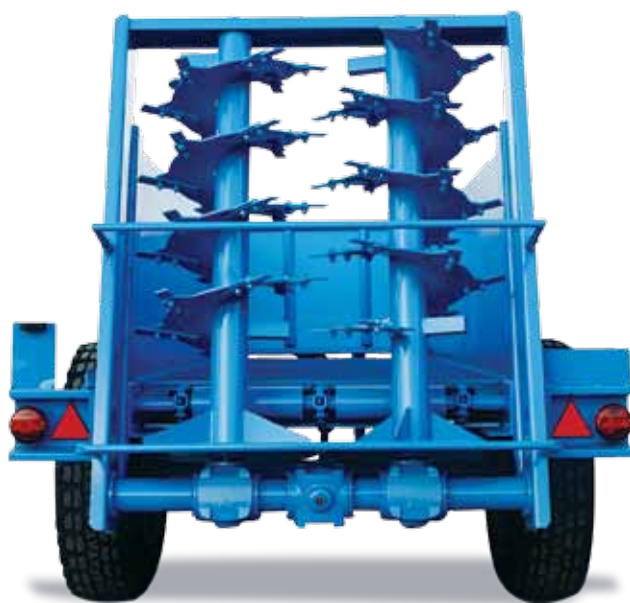
Rulli verticali per RP80