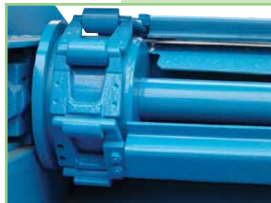
Catene speciali con traversino imbullonato