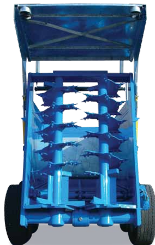
Rulli verticali per RP140