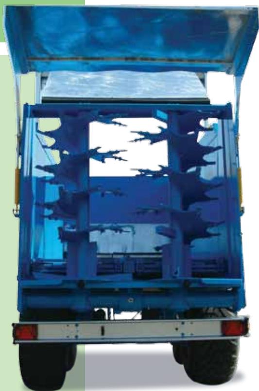
Rulli verticali per RPS140 e RP200